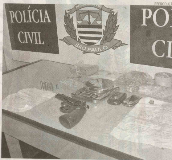
Drogas e revólver calibre 357 foram apreendidos em V. de Carvalho