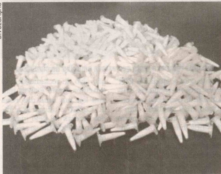
A cocaína estava no quarto de um adolescente, que foi detido acusado de tráfico

Após o registro do caso, o adolescente foi encaminhado para uma cela especial da cadeia pública anexa ao 1º Distrito Policial de Guarujá.